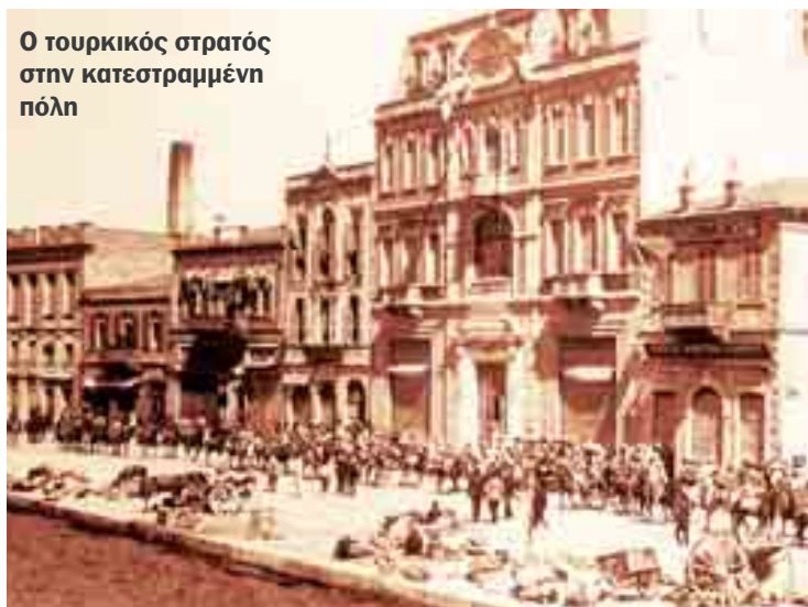
Ο τουρκικός στρατός στην κατεστραμμένη πόλη