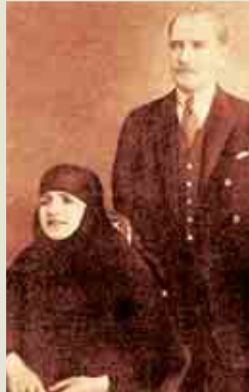
Ο Κεμάλ Ατατούρκ με τη σύζυγό του Λατιφέ. Ο έρωτάς τους «φούντωσε» μέσα στα αποκαΐδια της Σμύρνης

ορκισμένος εχθρός μας και κατέληξα στο συμπέρασμα ότι η Σμύρνη έχει ξεφύγει από τα χέρια των αληθινών και ευγενών